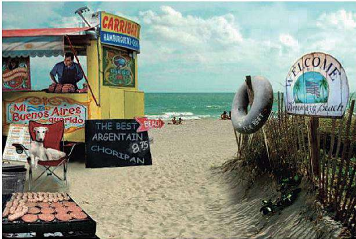
Biutiful Buenos Aires, 2010 Fotografía análoga y digital

Se dedica a las plataformas de fotografía y pintura, desde la figuración hasta la abstracción. Es un artista agudo en los diálogos que plantea con humor, con crítica social y desde la aventura de dinámicas a cual más diferente. Inventando situaciones o tomando escenas conocidas de la historia del arte, plantea interferencias que agudizan las percepciones del espectador.